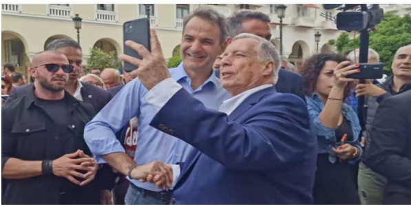
● Στράτος Λούβαρης

Δείτε βίντεο και φωτογραφίες - Ο πρωθυπουργός θα πραγματοποιήσει το απόγευμα προεκλογική ομιλία στο Παλέ ντε Σπορ – Συνομίλησε με καταστηματαρχες και με πολίτες